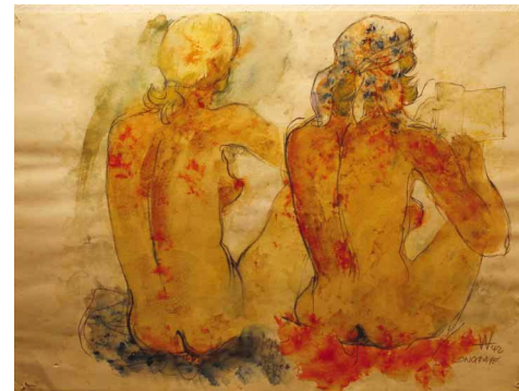
"Longfaye", aquarellierte Zeichnung 32 x 23,5 cm, 1942, Privatbesitz