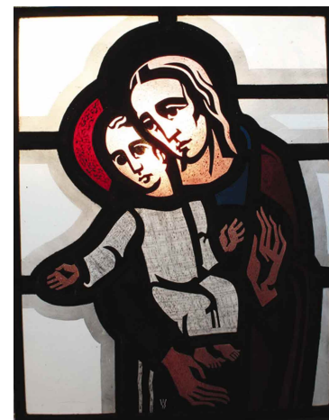
"Maria und Jesuskind" Glasfenster, 56 x 44 cm (nach einem Holzschnitt von 1947)