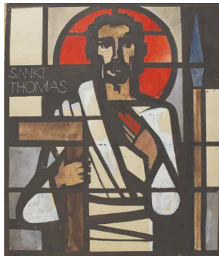
Kirchenfensterentwurf St. Thomas 32 x 37 cm, 1963